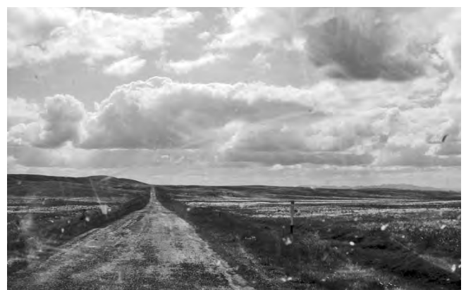
De horizon in Kazakstan

Ook de finish halen zal een hele strijd worden. Na een reparatie langs de weg waar ook wij assistentie verlenen, rijdt de truck door naar Moskou voor een definitieve reparatie. Wij vervolgen de rally 1 dag zonder assistentie. De wegen zijn slecht, de verbindingroutes zijn lang en de specials zijn kort. De organisatie is echter perfect: iedere dag is er een goed ontbijt en hoe laat je 's avonds ook binnenkomt je kunt altijd nog warm eten en de mensen die ons bij start en finish begeleiden hebben altijd een vriendelijk en motiverend woordje klaar. Het bivak in Yelabooga aan het eind van de derde dag is erg indrukwekkend. Er is een plek uitgekozen boven op een berg met een magnifiek uitzicht op de rivier de Kama. De Kama is de langste zijrivier van de Wolga. Hij ontspringt in het centrale deel van de Boven-Kama Hoogte bij de selo (dorp) Koeligi in het noordoosten van Oedmoertië. De naam van deze rivier vind je ook terug bij de Russische Kamaz vrachtwagens die met een sterk team meedoen aan deze rally. In dit bivak is een grootse ontvangst voorbereid door de plaatselijke bevolking en hun hoogwaardigheidsbekleders. Met muziek en dans worden we vermaakt. Helaas is de tijd te krap om er lang van te genieten. Er moet worden gesleuteld en, indien mogelijk, ook nog wat geslapen worden voor we aan de laatste twee dagen Rusland beginnen. Als we de grens Rusland Kazakstan passeren komen we in Kazakstan, wat achteraf het slechtste stuk van deze rally blijkt te zijn.