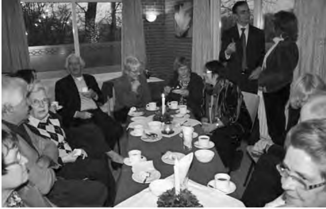
De familie op de receptie