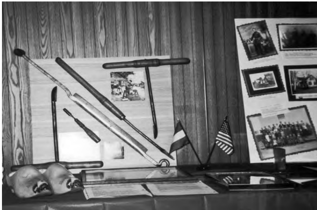
Het uit Nederland meegebrachte klompenmakersgereedschap.