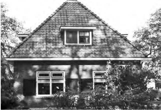
Huize Mallum in Eibergen

terecht is gekomen. Het was mijn overgrootmoeder die in 1924 met haar tweede man van Aalten naar Eibergen verhuisde. De landbouwgronden bij Aalten waren beter dan die bij Eibergen, maar werden alsmaar schaarser. Vandaar dat het toch aantrekkelijk werd om naar Eibergen te verhuizen. De familie betrok eerst een boerderij aan de Groenloseweg en na het pensioen huize Mallum, net buiten Eibergen. De boerderij en het huis staan er gelukkig nog.