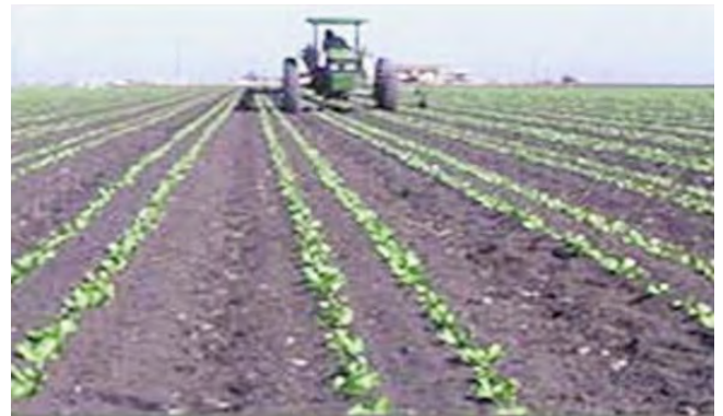
Machinaal geplante slavelden

In de Verenigde Staten is sla, het belangrijkste plantaardige gewas uit deze omhulde zaadjes. Ruwweg 95.000 Ha (235.000 acres).