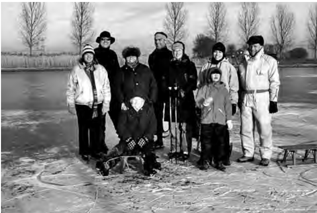
Allemaal op het Ganzendiep bij Kampen

Mijn vader en mijn moeder hebben de schaatsen niet meer onder gebonden; hij is 2 maart 80 jaar geworden en trok mijn moeder op de slee.