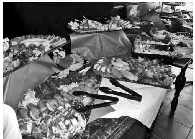
Brunsveld, onze cateraar zorgde al vroeg op de avond voor een uitgebreide en overvloedige barbecue

Enkelen hebben een bezoek gebracht aan het Somsenhuis en daar ook nog even de gedenkplaat gepoetst.