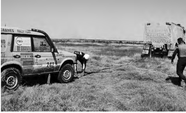
Losgetrokken door het Liazteam