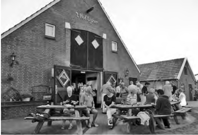
Het Somsen terras bij de camping achter 't Hoflijzer

Wij hebben ons het eten op het zonnige terras achter de boerderij goed laten smaken. Doordat veel aanwezige Somsens op het nabij gelegen kampeerterrein stonden, was er voor hen geen risico om op de terugweg naar huis aangehouden te worden met drank op. Door het heerlijke weer liep de ontspannen avond door tot ruim 23 uur en zo hebben wij ook nog kunnen kijken naar de maansverduistering die er die avond was.