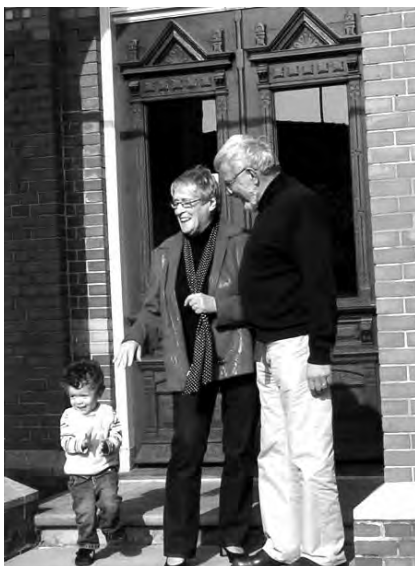
Bij het gemeentehuis in Eibergen.

muur waar ooit het huisnummer heeft gehangen dat op de foto te zien was. Dit gaf een heel bijzonder gevoel