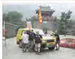
Op de omslag