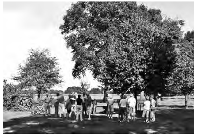
De Somsens rondom de boom