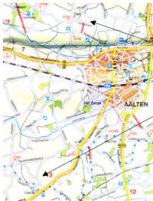
Pakkebierweg (pijl boven) Somsenhuis (pijl onder)

Na een nauwkeurig onderzoek vinden we gelukkig de Pakkebierweg op een kaart van Dale. Vervolgens trekken we er per auto op uit om die weg echt te vinden. Het duurt wel even om er te komen, omdat deze weg aan de andere kant van een beek ligt, vanaf de hoofdweg gezien, en we moeten er heen via een zandweggetje.